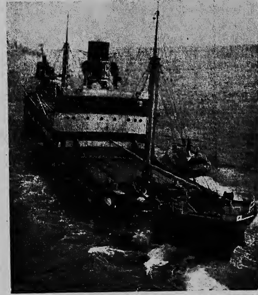
E bapor frances Diane a dal den kanal contra di Michael, un bapor di Liberia cu resultado cu e banda drechi di e bapor frances a keda basta danja. Esaki ta e bapor frances cu awa ta drenta y sali for di e parti dilanti.

ORANJESTAD. — Ayera nan a tene toelatings-examen pa e departamento di HBS na Julianaschool. Nan a conta cu mas o menos 20 candidato y ayera mainta a presenta 39. Siete maestro mester a ser agrega pa laga e examen tin un bon fin. Probablemente e resultado lo ser publica awe tardi pa banda di cinco or.